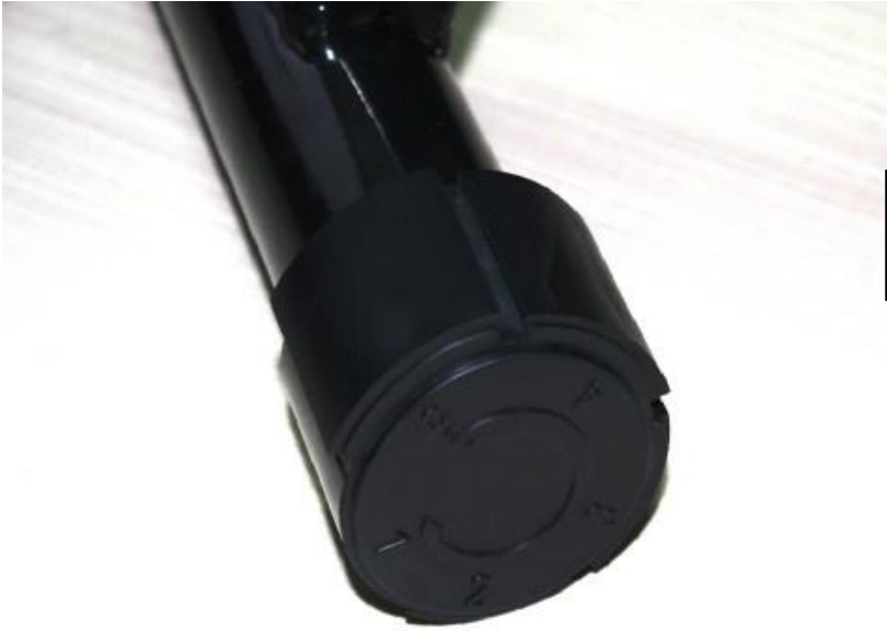
四腳腳墊具有標示 1,2,3,4,5 等高低來調整地面高度