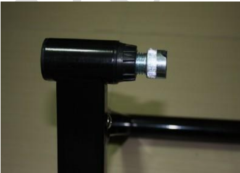
防鬆脫環狀螺旋卡準設計可 避免騎乘過程造成框架鬆動 的危險