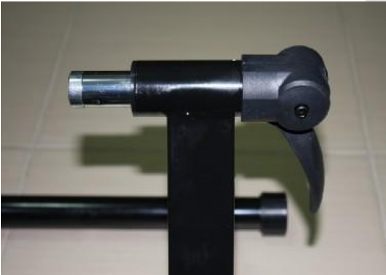
快拆快放安裝板柄設計