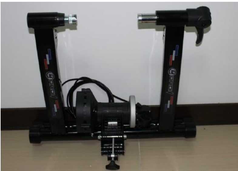
可一秒快速，輕鬆的牆角(邊) 折疊收納