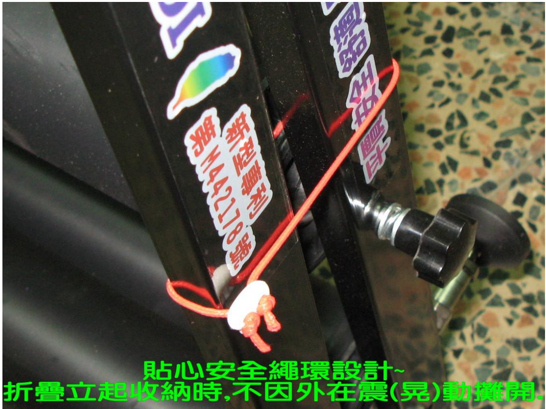
貼心安全繩環設計~ 折疊立起收納時,不因外在震(晃)動攤開.